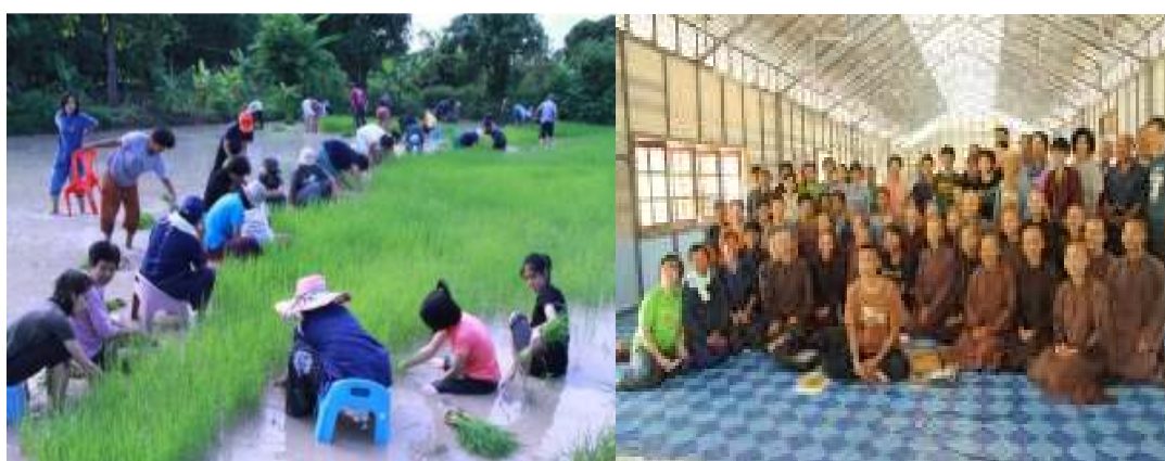
ภาพที่ 19 กิจกรรมการลงแขกในค่ายพระไตรปิฎกครั้งที่ 5 ณ สวนป่าอนุญ 1 จังหวัดมุกดาหาร วันที่ 6 กรกฎาคม 2555 และค่ายสุขภาพแพทย์วิถีพุทธ สำหรับนักบวชหมู่บ้านพลัม ณ ชุมชนมหาวิทยาลัยอุบลราชธานี จังหวัดอุบลราชธานี วันที่ 18 เมษายน 2555 ตามลำดับ