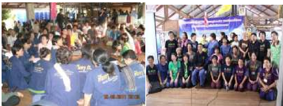
ภาพที่ 18 ค่ายพระไตรปิฎก (แฟนพันธ์แท้) และประชุมจิตอาสาทั่วประเทศ วันที่ 30 เมษายน 2554 และค่ายแฟนพันธ์แท้ ครั้งที่ 6 มอบปลอกแขนจิตอาสา รุ่น 2 วันที่ 27 ตุลาคม 2555 ตามลำดับ ณ สวนป่าอนุญ 1 อำเภอคอนคาต จังหวัดมุกดาหาร