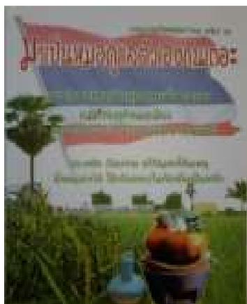
7. ถอดรหัสสุขภาพ เล่ม 3 มาเป็นหมอดูแลตัวเองกันเถอะ (พิมพ์ครั้งที่ 17)