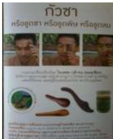
18. แผ่นพับ กัวซา