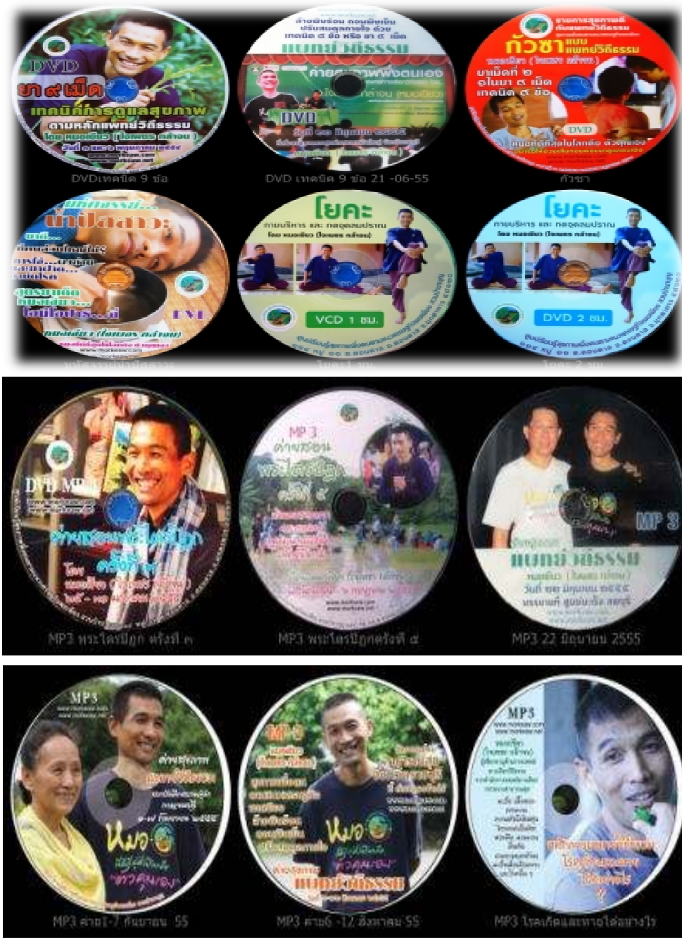
ภาพที่ 113 ผลงานสื่อ CD, DVD, VCD และ MP3 ของผู้วิจัย