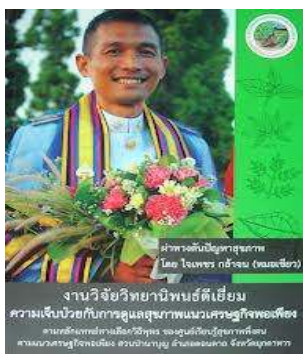
1. งานวิทยานิพนธ์ดีเยี่ยมความเจ็บป่วยกับการดูแลสุขภาพตามแนวเศรษฐกิจพอเพียง