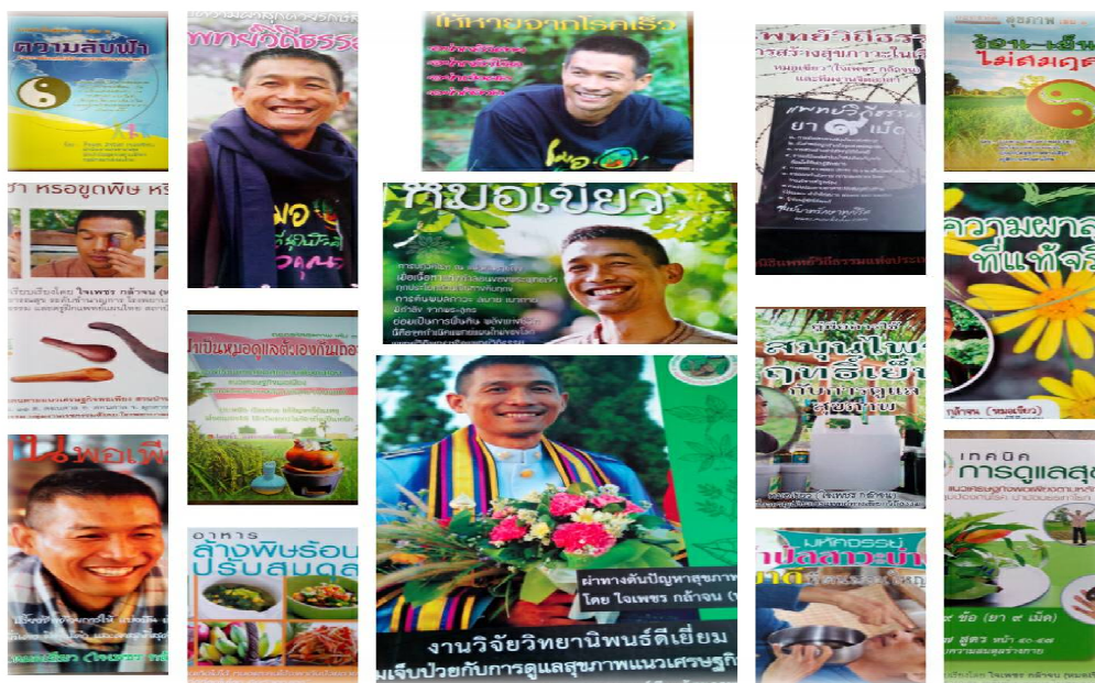
ภาพที่ 107 ข้อมูลแพทย์วิถีธรรมในรูปแบบของสิ่งพิมพ์ ได้แก่ หนังสือ วารสาร แผ่นพับ แผ่นการ์ดต่างๆ