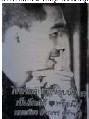
10. ไขรหัสลับสุดยอดข้อฟ้า 3 โสคติหรือมีคู่

ภาพที่ 108 ภาพแสดงหน้าปกหนังสือการแพทย์วิถีพุทธ สุขภาพพึ่งตนตามแนวเศรษฐกิจพอเพียง แต่ละเล่ม