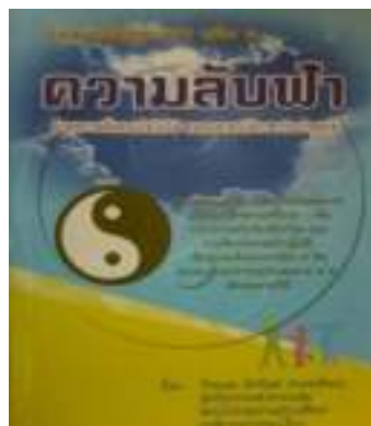
6. ถอดรหัสสุขภาพ เล่ม 2 ความลับฟ้า (พิมพ์ครั้งที่ 15)