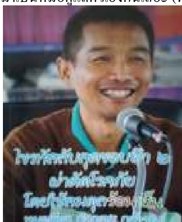
9. ไขรหัสลับสุดยอดข้อฟ้า 2 ผ่าตัดโรคร้ายโดยใช้สมดุสร้อนเย็น