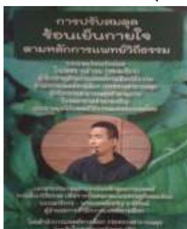
16. การปรับสมดุลร้อนเย็นกายใจตามหลักการแพทย์วิถีธรรม

ภาพที่ 108 ภาพแสดงหน้าปกหนังสือการแพทย์วิถีพุทธ สุขภาพพึ่งตนตามแนวเศรษฐกิจพอเพียง แต่ละเล่ม