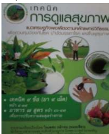
13. เทคนิคการดูแลสุขภาพ