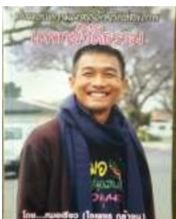
21. สมุดบันทึกวิถีสุขภาพแพทย์วิถีธรรม