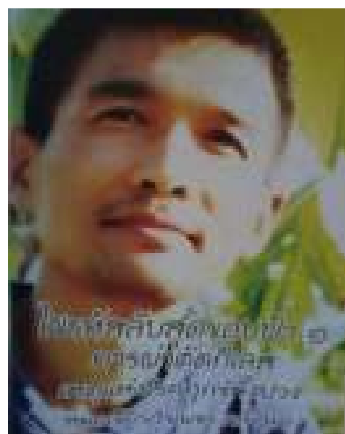
8. ไขรหัสลับสุดยอดข้อฟ้า 1 การผ่าตัดกิลเลสเหตุแห่งโรคทุกขั้ทั้งปวง