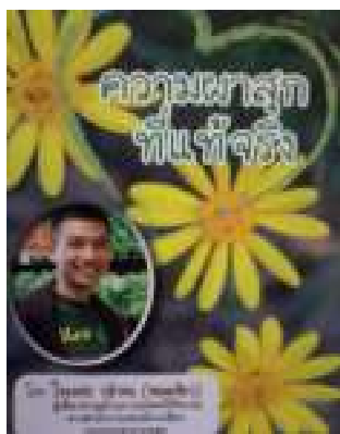
ความสุขที่แท้จริง