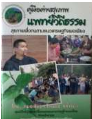
17. คู่มือค่ายสุขภาพ