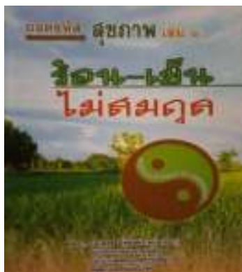
5. ถอดรหัสสุขภาพ เล่ม 1 ร้อน-เย็น ไม่สมดุล (พิมพ์ครั้งที่ 30)