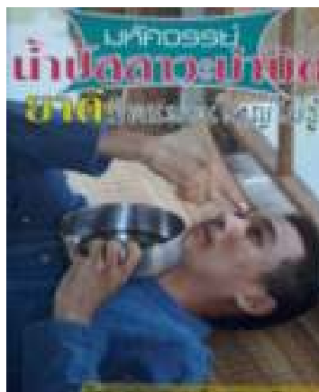
12. มหัศจรรย์น้ำปลาคั่ว