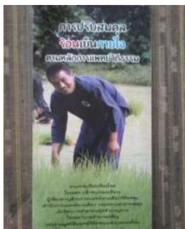
20. โยชัวร์ การปรับสมดุลร้อนเย็นภายใน