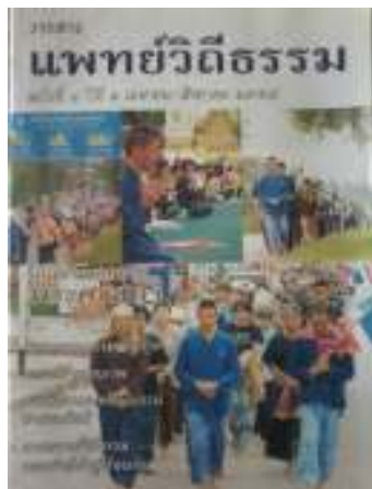
23. วารสารแพทยวิถีธรรม ฉบับที่ 4