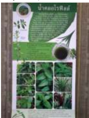
19. แผ่นการ์ด น้ำคอกโรฟิลล์