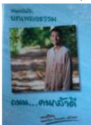
22. สมุดบันทึกบทเพลงธรรม

ภาพที่ 108 ภาพแสดงหน้าปกหนังสือการแพทย์วิถีพุทธ สุขภาพพึ่งตนตามแนวเศรษฐกิจพอเพียง แต่ละเล่ม