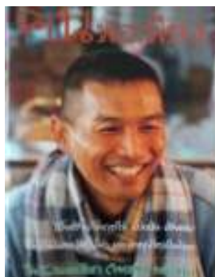
คนพอเพียง