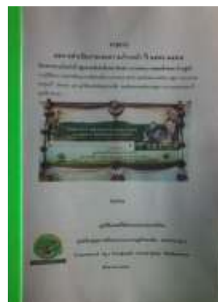
รายงานความก้าวหน้าโครงการสักฯ

ภาพที่ 112 ภาพแสดงหน้าปกหนังสือ “สังจะภูชาติ” และ “ผลการดำเนินการและความก้าวหน้า ปี 2556-2557 โครงการรวมใจภักดิ์ ปลุกมเหสักข์-สักสยามินทร์ ถวายพระบาทสมเด็จพระ พระเจ้าอยู่หัว”