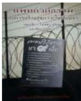
2. แพทย์วิถีธรรมกับการสร้างสุขภาพะในเรือนจำ