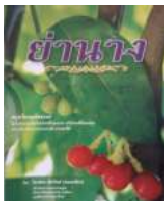
4. ย่านาง สมุนไพรมหัศจรรย์ (พิมพ์ครั้งที่ 24)

ภาพที่ 108 ภาพแสดงหน้าปกหนังสือการแพทย์วิถีพุทธ สุขภาพพึ่งตนตามแนวเศรษฐกิจพอเพียง แต่ละเล่ม