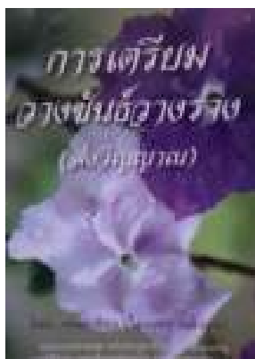
การเตรียมวางขันธวางรัง (สังฆญาณ)