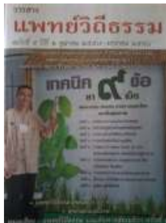
24. วารสารแพทยวิถีธรรม ฉบับที่ 5

ภาพที่ 108 ภาพแสดงหน้าปกหนังสือการแพทย์วิถีพุทธ สุขภาพพึ่งตนตามแนวเศรษฐกิจพอเพียง แต่ละเล่ม