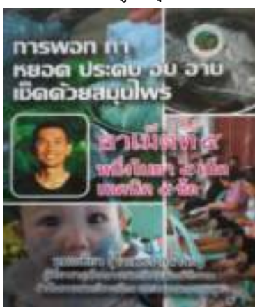
15. การพอก ทา หยอด ประคบ อบ อบ เช็ด ด้วยสมุนไพร