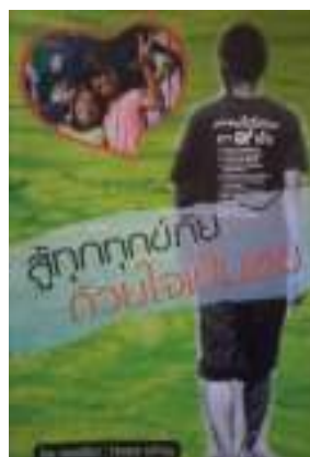
ผู้ทุกข์ทุกข์ด้วยใจเป็นสุข

ภาพที่ 111 ภาพแสดงหน้าปกหนังสือการแพทย์วิถีพุทธ เพื่อเผยแพร่สัจธรรมและสืบสาน พระพุทธศาสนา แต่ละเล่ม