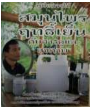
11. คู่มือการใช้สมุนไพรฤทธิ์เย็น