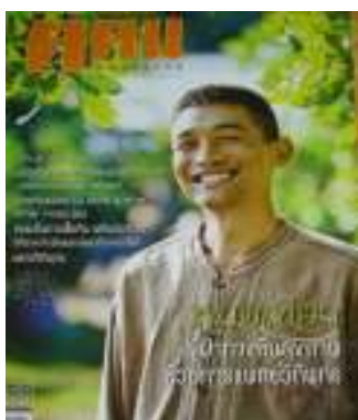
3. หมอเขียว ผู้ฝ่าทางตันสุขภาพด้วยการแพทย์วิถีพุทธ