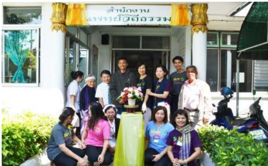
ภาพที่ 86 ผู้วิจัยร่วมเปิดสำนักงานแพทย์วิถีธรรม ที่โรงพยาบาลโพธาราม จ.ราชบุรี