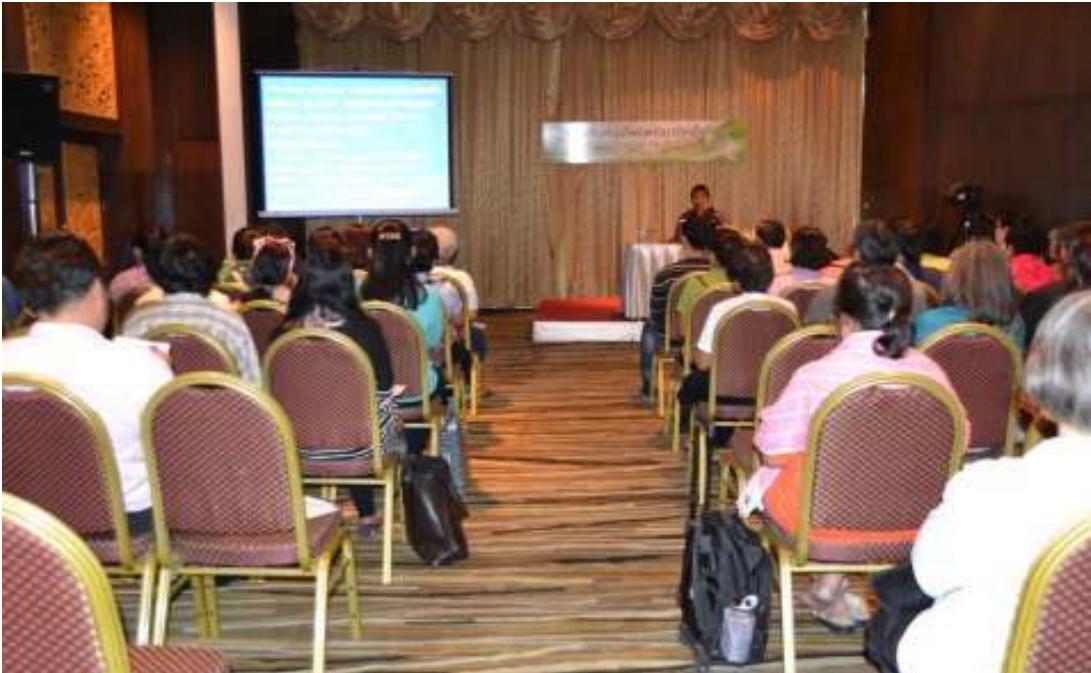
ภาพที่ 80 งานมหกรรมสมุนไพรมหาแห่งชาติ ครั้งที่ 10 โดยกรมการพัฒนาแพทย์แผนไทยและการแพทย์ทางเลือก เมืองทองธานี ปทุมธานี วันที่ 7 กันยายน 2556