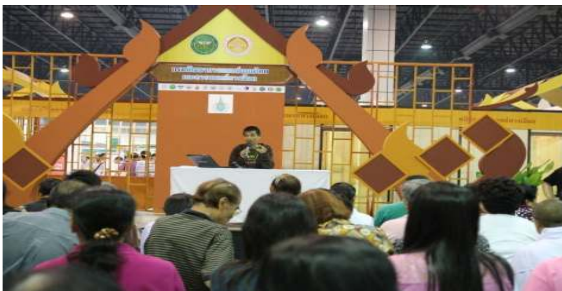
ภาพที่ 79 งานมหกรรมสมุนไพรแห่งชาติครั้งที่ 9 โดยกรมการพัฒนาแพทย์แผนไทยและการแพทย์ทางเลือกเมืองทองธานี กรุงเทพฯ วันที่ 5 กันยายน 2555