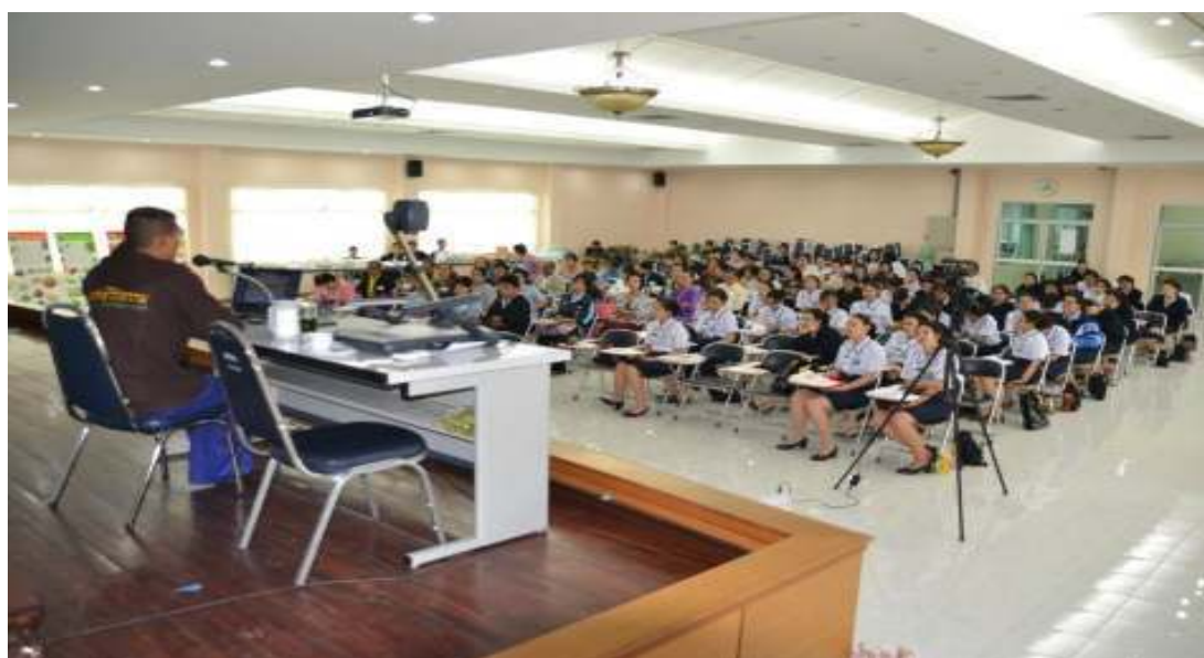
ภาพที่ 87 บรรยายสุขภาพ ณ วิทยาลัยพยาบาลทหารอากาศ วันที่ 6 สิงหาคม 2556