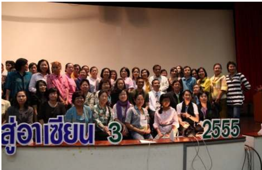
ภาพที่ 76 ผู้วิจัยบรรยาย ที่มหาวิทยาลัยสุโขทัยธรรมมาธิราช วันที่ 9 กันยายน 2555 ที่มา (จรรย์นัท ทับเนียม, ภาพถ่าย. 2555, กันยายน 9)