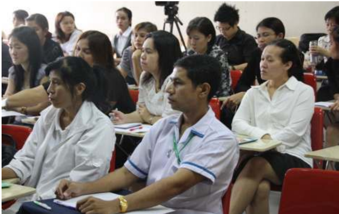
ภาพที่ 82 บรรยายสุขภาพที่ศิริราชพยาบาล กรุงเทพฯ วันที่ 30 สิงหาคม 2554