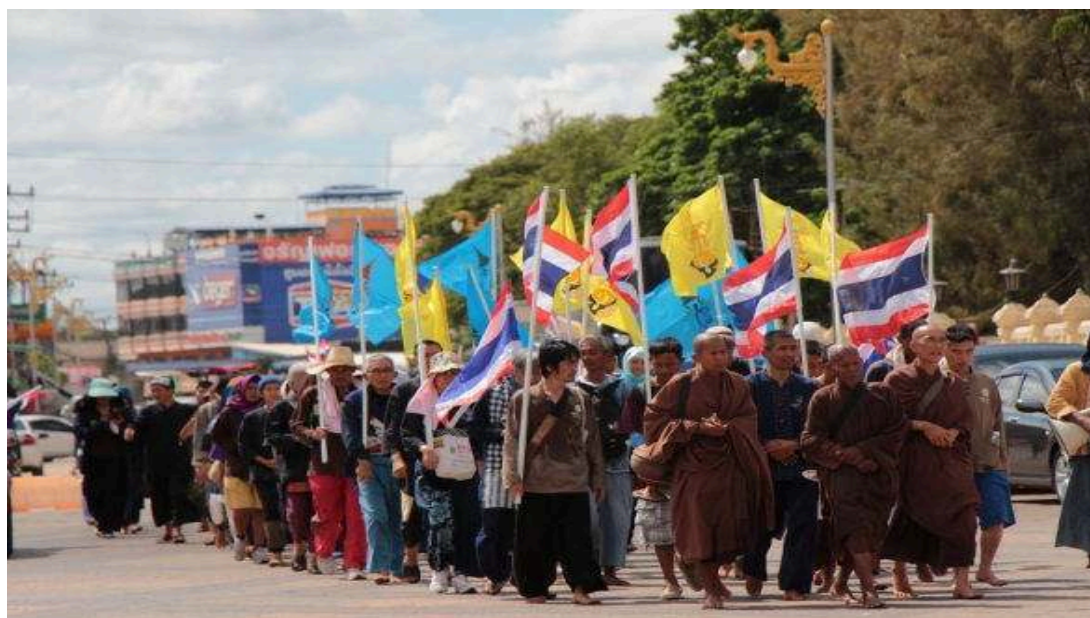
ภาพที่ 91 เดินจาริกจากสวนป่านาบุญ 4 (บ้านแดนสวรรค์) อ.ธาตุพนม เพื่อไปสักการะพระธาตุ พนม อ.ธาตุพนม จ. นครพนม เป็นระยะทางทั้งสิ้น 23 กิโลเมตร