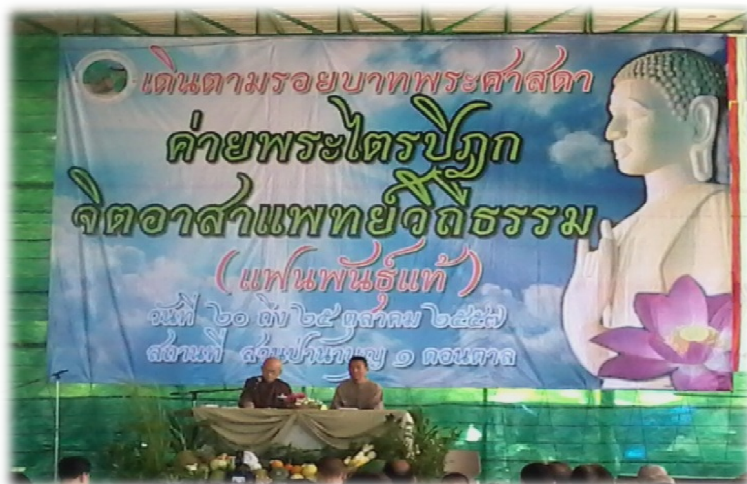
ภาพที่ 89 ค่ายพระไตรปิฎกจิตอาสาแพทย์จิตธรรม เดินตามรอยบาทพระศาสดา สวนป่าบุญ 1 จ.มุกดาหาร วันที่ 19-23 ตุลาคม 2557 ที่มา (ดิษฐ์ ไอราวินวัฒน์, ภาพถ่าย. 2557, ตุลาคม 23)