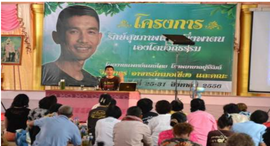
ภาพที่ 88 โครงการรักษาสภาพแบบพึ่งพาตนเองโดยวิธีธรรม วัดธรรมธีราราม จ.บุรีรัมย์ โดยงานแพทย์แผนไทย โรงพยาบาลบุรีรัมย์ วันที่ 25-31 สิงหาคม 2556