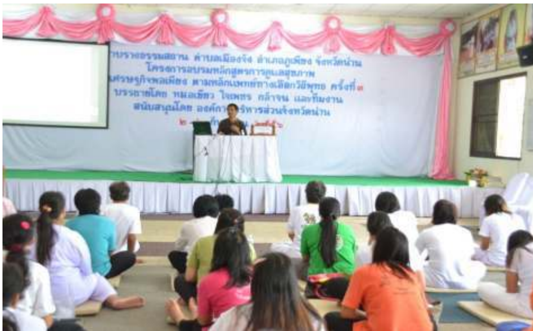
ภาพที่ 78 โครงการอบรมหลักสูตรการดูแลสุขภาพตามแนวเศรษฐกิจพอเพียงตามหลักการแพทย์ทางเลือกวิถีพุทธ ครั้งที่ 3 วัดวางกบรางสถาน จ.น่าน วันที่ 2-6 กันยายน 2556