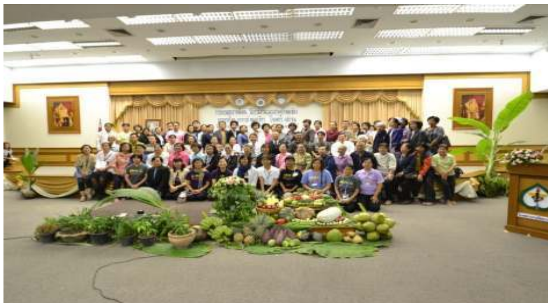
ภาพที่ 83 การอบรมสุขภาพพึ่งตนวิถีธรรมตามแนวเศรษฐกิจพอเพียงโรงพยาบาลโพธารามร่วมกับ สำนักงานสาธารณสุข จ.ราชบุรี วันที่ 15 มกราคม 2556