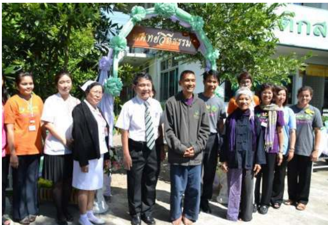
ภาพที่ 85 ผู้วิจัยร่วมเปิดหน่วยงานแพทย์วิถีธรรม ที่โรงพยาบาลโพธาราม จ.ราชบุรี