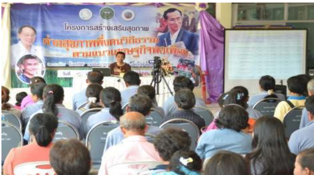
ภาพที่ 84 โครงการสร้างเสริมสุขภาพ ค่ายสุขภาพพึ่งตนวิถีธรรม ตามแนวเศรษฐกิจพอเพียง โรงพยาบาลอำนาจเจริญ จ.อำนาจเจริญ วันที่ 4 กันยายน 2556