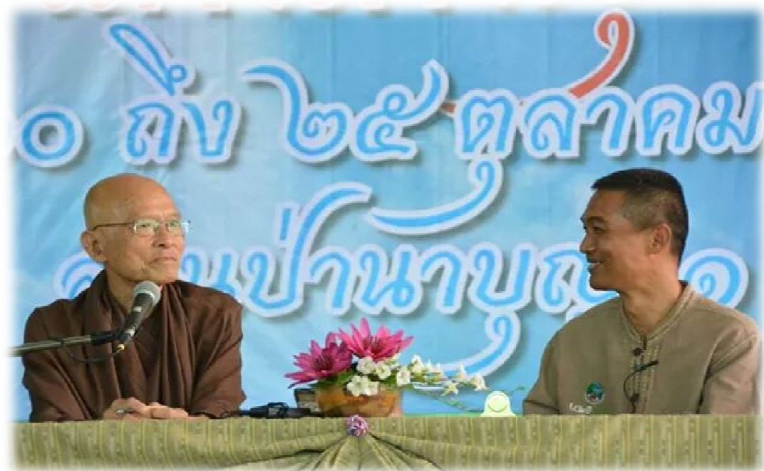
ภาพที่ 90 ถ่ายพระไตรปิฎกจิตอาสาแพทย์วิถีธรรม เดินตามรอยบาทพระศาสดา สวนป่านาบุญ 1 จ.มุกดาหาร วันที่ 19-23 ตุลาคม 2557