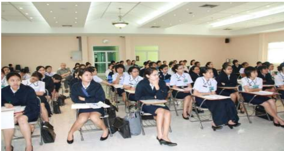
ภาพที่ 81 นักศึกษาวิทยาลัยพยาบาลทหารอากาศ เข้ารับฟังการบรรยายการแพทย์วิถีธรรม ณ วิทยาลัยพยาบาลทหารอากาศ วันที่ 17 สิงหาคม 2554