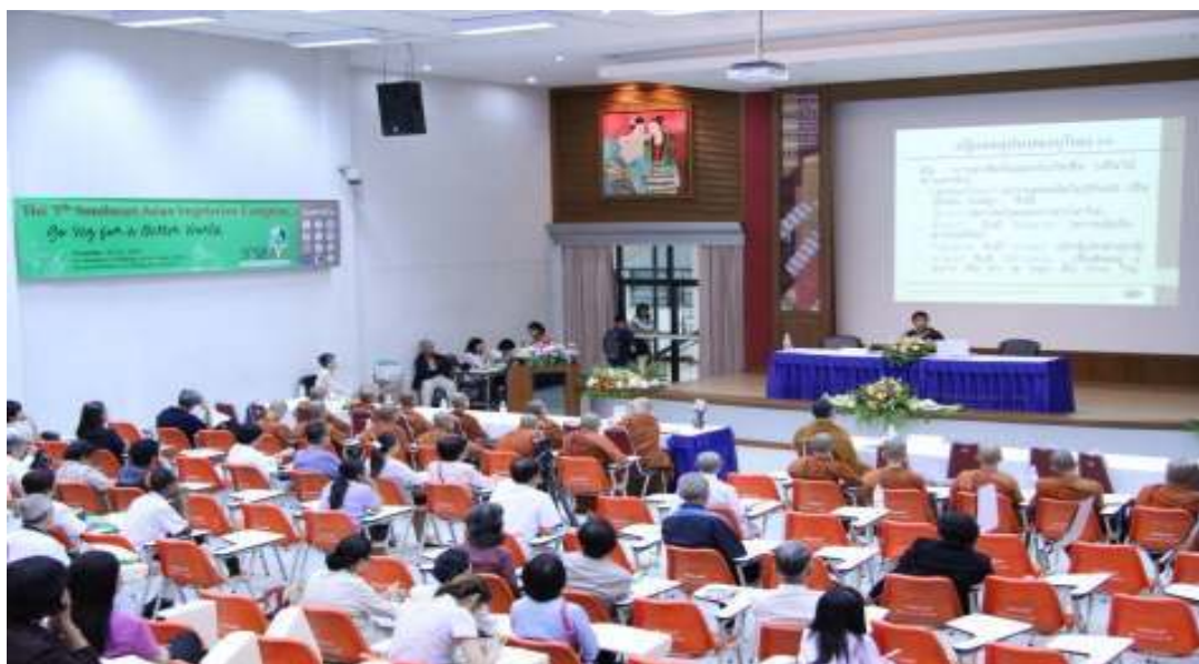
ภาพที่ 77 ผู้วิจัยบรรยายในงานสัมมนา มังสวิรัตโลก มหาวิทยาลัยเชียงใหม่ The 5th Southeast Asian Vegetarian Congress go Veg for a better World วันที่ 24 พฤศจิกายน 2555