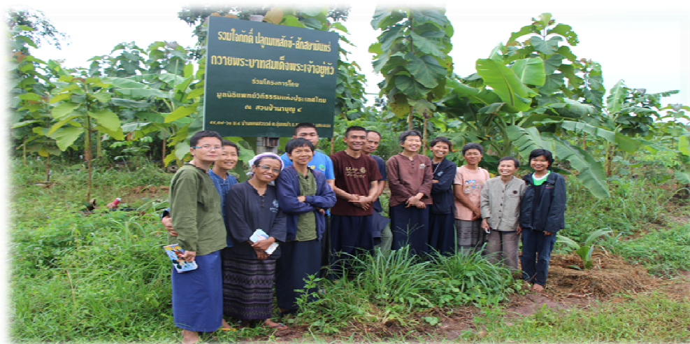
ภาพที่ 93 ผู้วิจัยและจิตอาสาแพथิวิธิพุทธ ถ่ายภาพร่วมกันหน้าป่าโครงการรวมใจกักตัก ปลุคมเหล็ก-สักสยามินทร์ ถวายพระบาทสมเด็จพระเจ้าอยู่หัว เนื่องในวโรกาสมหามงคล เฉลิมพระชนมพรรษา 84 พรรษา 5 ธันวาคม 2554 ณ สวนป่านาบุญ 4 ในพื้นที่ประมาณ 120 ไร่